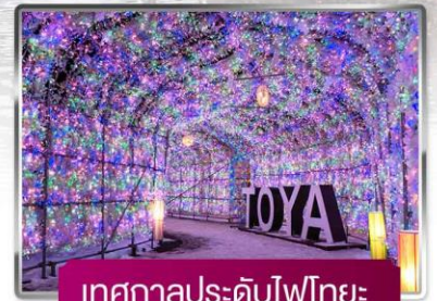
เทศกาลประดับไฟไทยะ