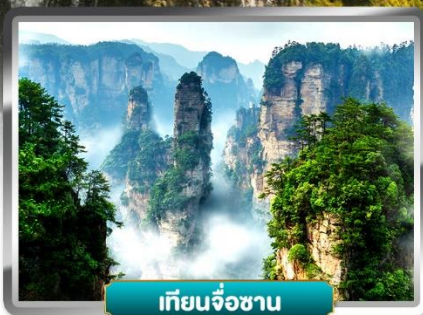
เทียนจื่อซาน