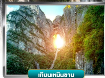
เทียนเหมินซาน