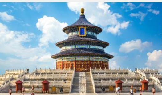
หอบูชาฟ้าเทียนถาน