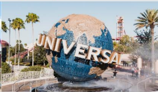
ยูนิเวอร์เซล ปักกิ่ง รีสอร์ท