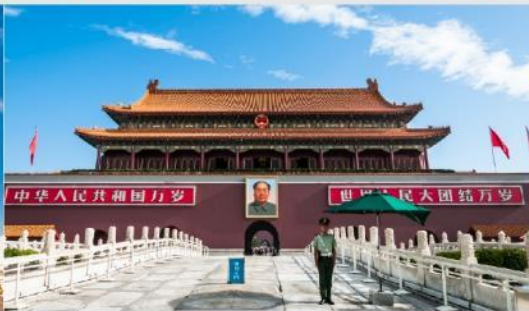
จตุรัสเทียนอันเหมิน