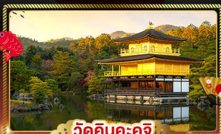
วัดคินคะคุจิ