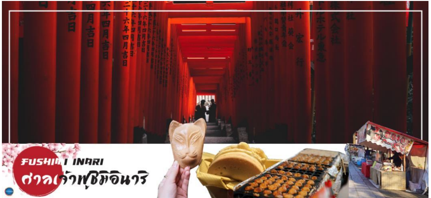
FUSHIMI INARI ศาลเจ้าฟูชิมิอินาริ

จากนั้นนำท่านสู่ ศาลเจ้าฟูชิมิอินาริ (Fushimi Inari Shrine or Fushimi Inari Taisha) ศาลเจ้าเส้าโทริอิพันต้นแห่งเกียวโต (จริงๆมีเป็นหมื่นๆ ต้น) หรือที่คนไทยชอบเรียกกันว่า ศาลเจ้าจิ้งจอก หรือ ศาลเจ้าแดง เป็นศาลเจ้าชินโตสร้างถวายเป็นเทพอินาริ ซึ่งเป็น เทพแห่งพืชพันธุ์ธัญญาหารของญี่ปุ่น ช่วยบันดาลในหลายเรื่องตั้งแต่ พืชพันธุ์ธัญญาหาร, ค่าขายรุ่งเรือง, คลอดบุตรปลอดภัย, โรคภัยหายป่วย และช่วยในเรื่องการขอให้สอบผ่าน เป็นต้น ศาลเจ้าแห่งนี้ มีชื่อเสียงโด่งดังจาก เส้าโทริอิสีแดง เรียงตัวกันจำนวนหลายหมื่นต้นจนเป็นทางเดินได้ทั่วทั้งภูเขาอินาริ ตามตำนานเล่าสู่ว่า โดยปกติแล้วเทพอินาริจะไม่สื่อสารกับมนุษย์เองโดยตรง แต่จะสื่อสารผ่านบริวารของท่าน นั่นคือ สุนัขจิ้งจอก (คิตสึเนะ 狐) นั่นเอง ทำให้มีรูปปั้นของสุนัขจิ้งจอกตั้งเรียงรายเต็มไปหมด จนคนทั่วไป นิยมเรียกศาลเจ้าแห่งนี้ว่า ศาลเจ้าจิ้งจอก อีสระให้ท่านขอพรและถ่ายรูปภาพตามอัธยาศัย