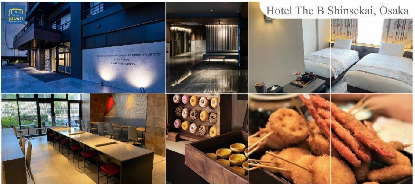
Hotel The B Shinsekai, Osaka

พักที่ HOTEL THE B SHINSEKAI, OSAKA หรือเทียบเท่าระดับเดียวกัน