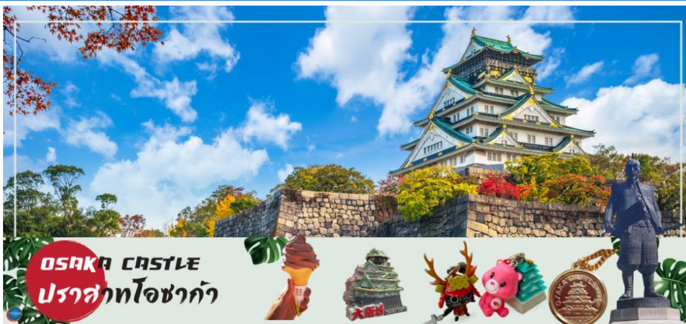
OSAKA CASTLE ปราสาทโอซาก้า

วันที่สี่ เมืองโอซาก้า – ปราสาทโอซาก้า(ด้านนอก) – ตลาดคุโรมง – ช้อปปิ้งชินไซบาชิ