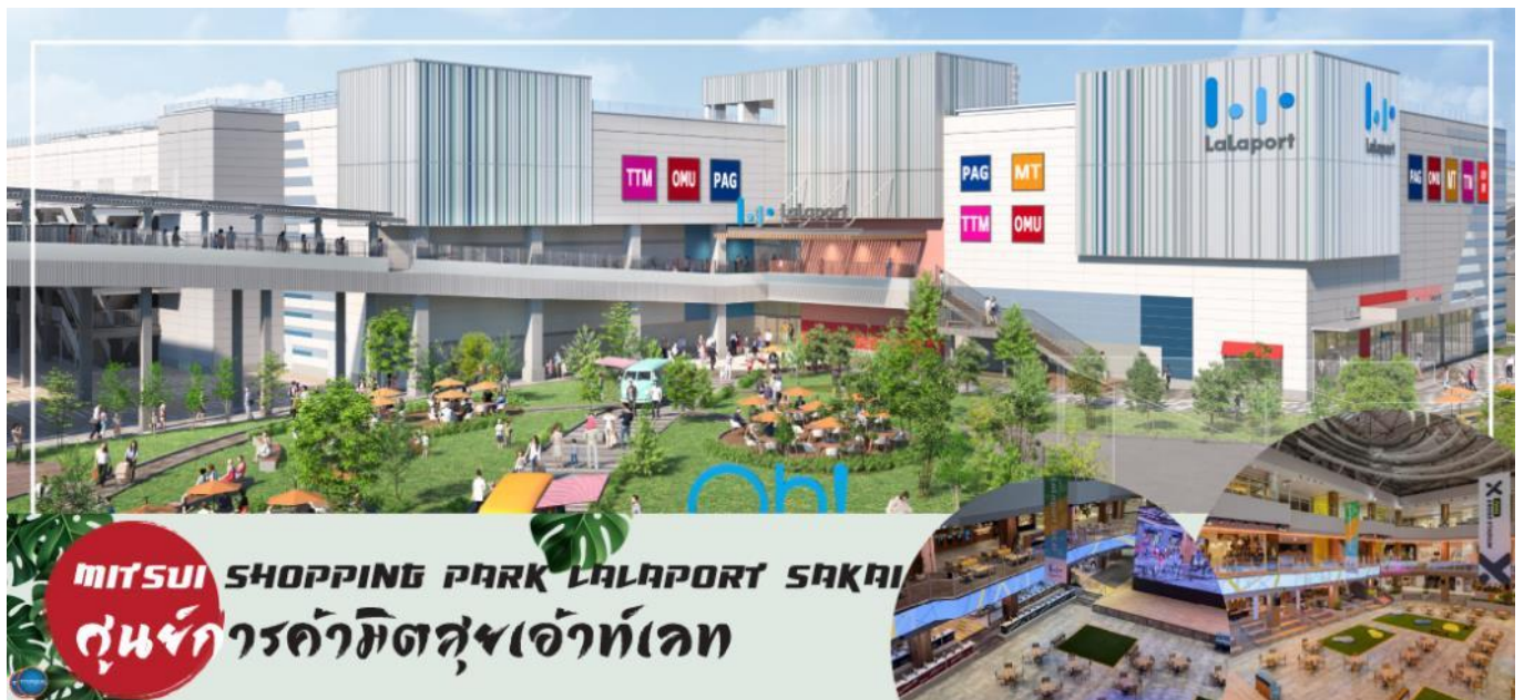
MITSUI SHOPPING PARK LALAPORT SAKAI ศูนย์การค้ามิตซูบิชิเอ้าท์เล็ต

นำท่านสู่ LALAPORT & MITSUI OUTLET PARK OSAKA KADOMA มีกำหนดเปิดให้บริการในวันที่ 17 เมษายน 2023 ที่ผ่านมา ซึ่งถือเป็นสาขาใหม่ล่าสุดที่มีเอกลักษณ์ในญี่ปุ่น โดยปกติแล้วศูนย์การค้าและเอาท์เล็ตจะแยกกันคนละที่ ดังนั้น นี่จึงเป็นครั้งแรกที่เป็นการรวมศูนย์การค้าขนาดใหญ่เข้าด้วยกันกับOutlet ขนาดใหญ่แห่งแรก ห้างสรรพสินค้าที่มีสิ่งอำนวยความสะดวกครบครัน