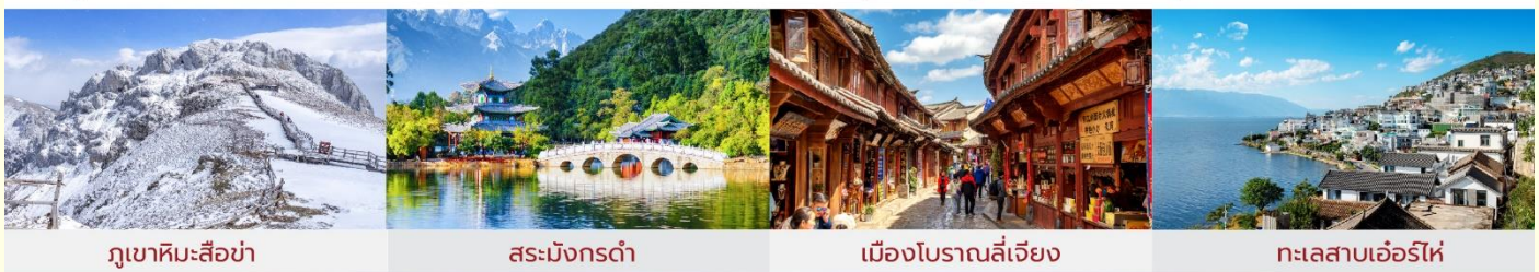
ภูเขาหิมะสี่อ่า