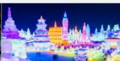
เทศกาลคอมไฟน้ำแข็ง