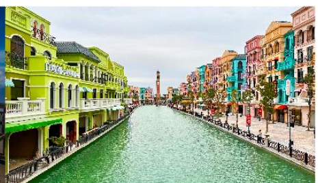
เมกาแกรนด์เวิลด์ฮานอย

*ทางบริษัทฯ ขอสงวนสิทธิ์ในการสลับโปรแกรมทัวร์ตามความเหมาะสมขึ้นอยู่กับสถานการณ์หน้างาน โดยคำนึงถึงผลประโยชน์ของลูกค้าเป็นสำคัญ