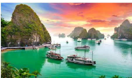
ล่องเรือชมอ่าวฮาลอง