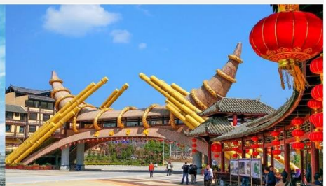
Dishui Miao cheng

*ทางบริษัทฯ ขอสงวนสิทธิ์ในการสลับโปรแกรมทัวร์ตามความเหมาะสมขึ้นอยู่กับสถานการณ์หน้างาน โดยคำนึงถึงผลประโยชน์ของลูกค้าเป็นสำคัญ