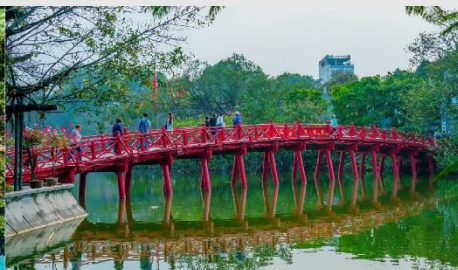
ทะเลสาบคินดาบ