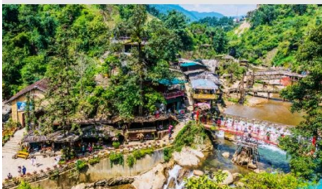
หมู่บ้าน Cat Cat