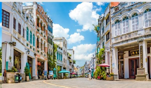
ถนนโบราณฉีไหลว