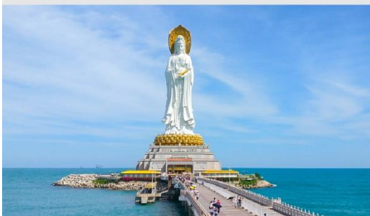
เจ้าแม่กวนอิมหนานชาน