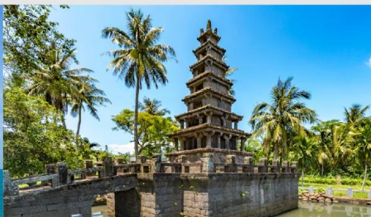
เจดีย์ 2 พี่น้องเหม่ยหลาน