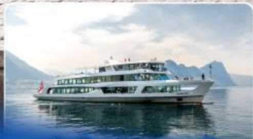
ล่องเรือทานอาหารกลางวัน ทะเลสาบลูซีร์น