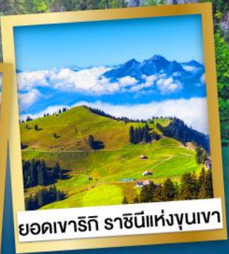
ยอดเขารัทชิ ราชินีแห่งขุนเขา