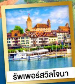
ริพเพอร์สวิลล์