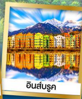
อินส์บรุค