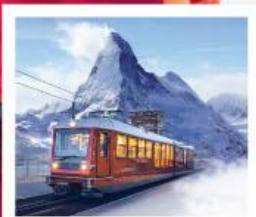
รถไฟเขารอนเนอร์เกรต