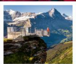
กรินเดลวาลด์เฟียส