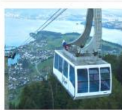
จันกระเซายอดเทาริกิ