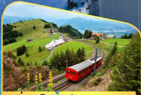
นั่งรถไฟขึ้นสู่ยอดเขาโรติก