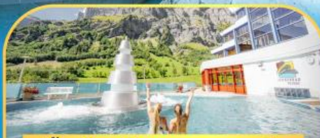
แช่น้ำแร่ร้อนผ่อนคลายลวยคอร์บิต