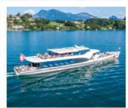
ส่งเรือทะเลสาบลูเซิร์น