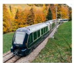
รถไฟโกลเด้นพาส