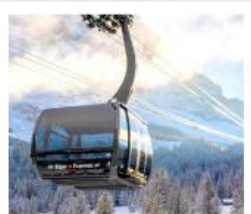
ขึ้นกระเช้ายอดเขาจุงเฟรา