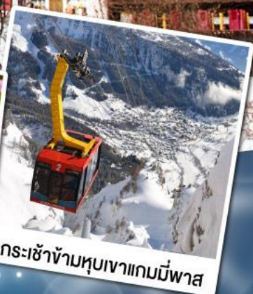
กระเช้าข้ามหุบเขาแกมมีพาส

18-24 ก.พ. 68 11-17 มี.ค. 68 02-08 เม.ย. 68 29 เม.ย.-05 พ.ค. 68