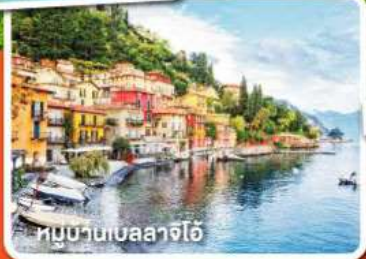
หมู่บ้านเบลลาจีโอ