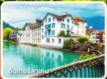
อินเทอร์ลาเคน