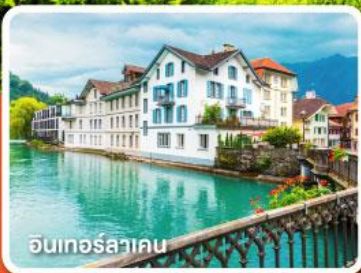
อินเทอร์ลาเคน