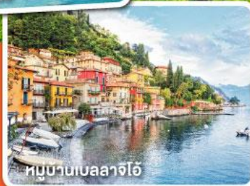
หมู่บ้านเบลลาจีโอ