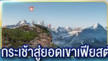
กระเช้าสู่ออดเขาเฟียสต์