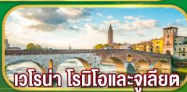
เอโรน่า โรมิโอและจูลียัต