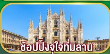
ซ็อบบิงจุงไทมิลาน

เดินทาง 07-14 เม.ย. 69 / 02-09 พ.ค. 69 27 พ.ค. - 03 มิ.ย. 69 / 17-24 มิ.ย. 69 22-29 ก.ค. 69 / 11-18 ส.ค. 69 16-23 ก.ย. 69