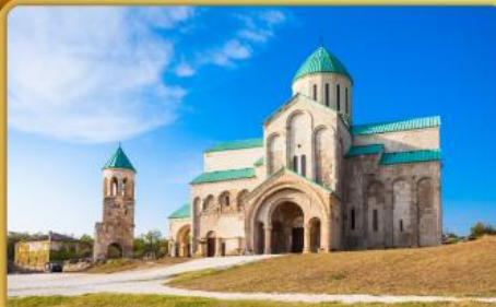
มหาวิหารบากราติ