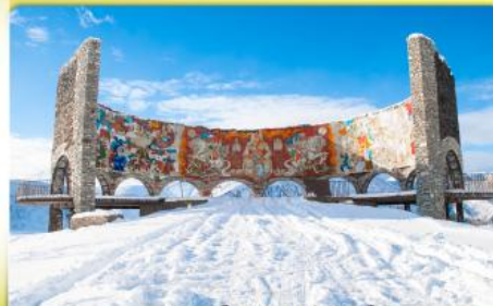
อนุสรณ์สถานรัสเซีย