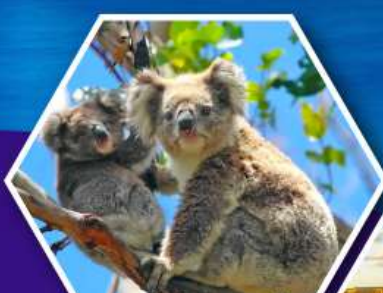
ชมหมีโคอาล่า ณ สวนสัตว์ซิดนีย์