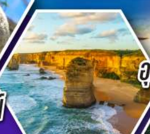
อุทยานบลูเมาส์แท่น