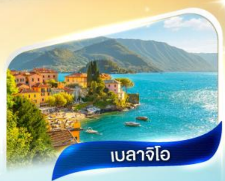
เบลลาจีโอ