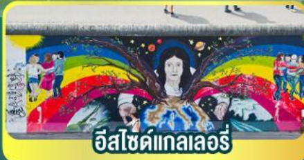
อีสไซด์แกลลอรี่