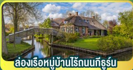
ล่องเรือหมู่บ้านไรน์บนทีกูร์น