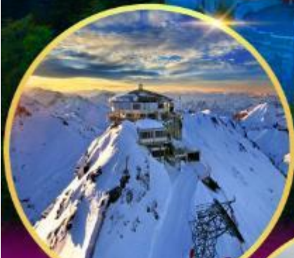
ยอดเขาซิลรอร์น