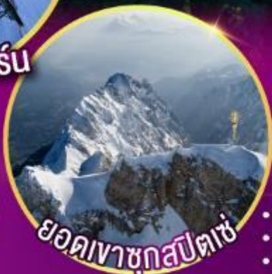
ยอดเขากุสปีตซ์