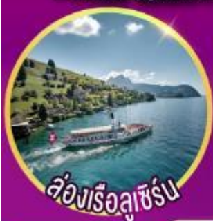
ห้องเรือลูเซิร์น