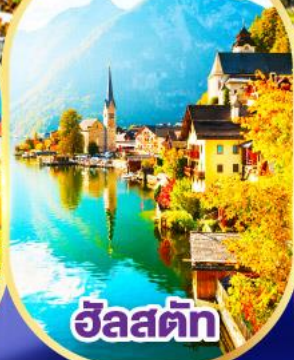
ซัลสตัดท์