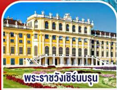
พระราชวังฮิรน์บรุน