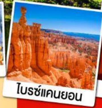
โบรซ์แคนยอน