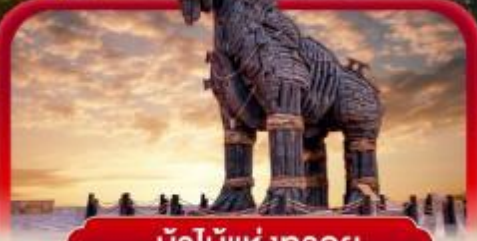
ม้าไม้แห่งทรอย