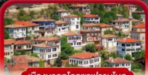
เมืองมรดกโลกชาฟรานโบลู