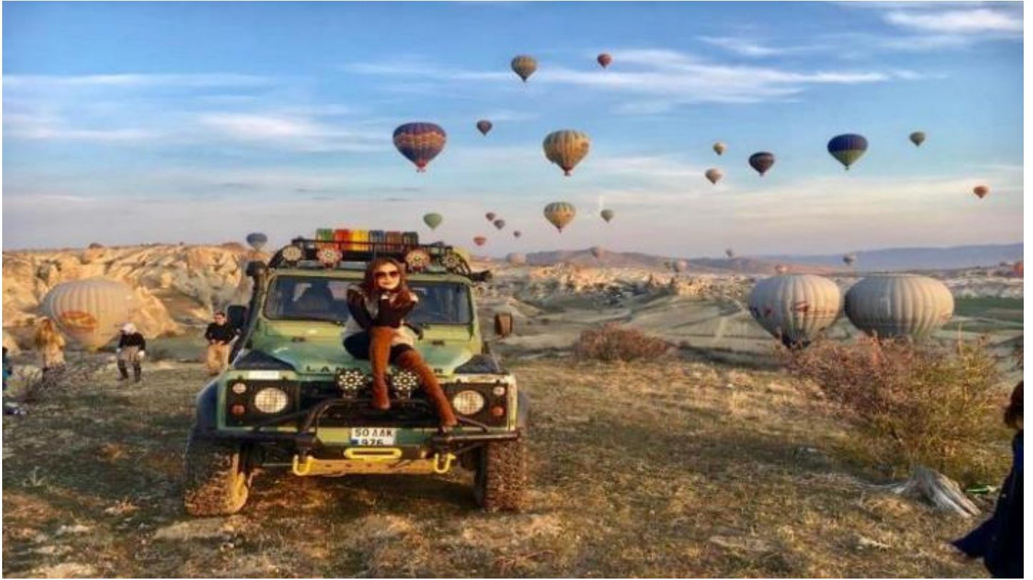
3. Classic Car นั่งรถคลาสสิก เปิดประทุน สูดอากาศ เย็น สดชื่น พร้อมชมบอลลูนสีสดใส วิวเมือง คัปปาโดเกีย ค่าใช้จ่าย 120 USD / ท่าน