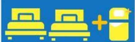
เตียง 3 ก้น ที่นอนเสริม TRIPLE