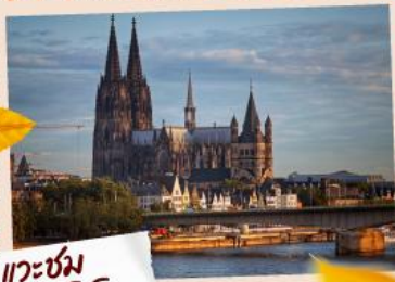
แวะชม มหาวิหารโคโลญ