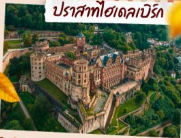
ปราสาทโศดเคบรีก