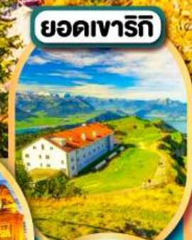
ยอดเขาเรทิก