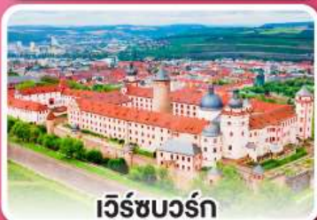
เว็ร์ซบวร์ค