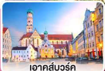
เอาคส์บวร์ค