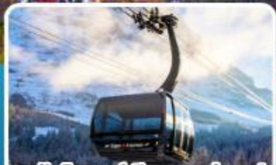
กระเช้าไอเกอร์เอ็กสเพรส สู่อยอดเขาจุงเฟรา

อิตาลี สวิตเซอร์แลนด์ ฝรั่งเศส 10 วัน 7 คืน