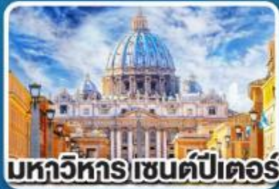
มหาวิหารเซนต์ปีเตอร์