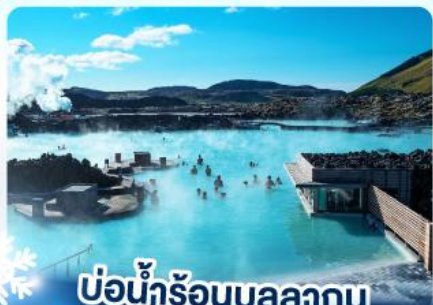
แช่น้ำร้อนบลูลากูน

เก็บไอซ์แลนด์ แคนกูวาไฟร์กรูฟลา และ แช่น้ำร้อนบลูลากูน