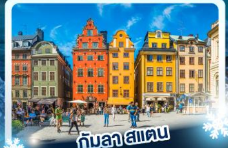
กับลาสแตน