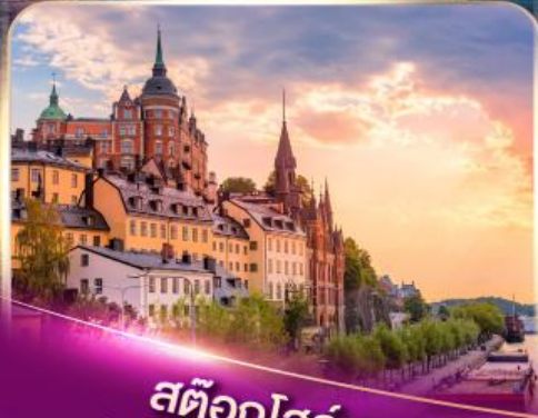
สต็อกโฮล์ม เวนิสแห่งยุโรปเหนือ