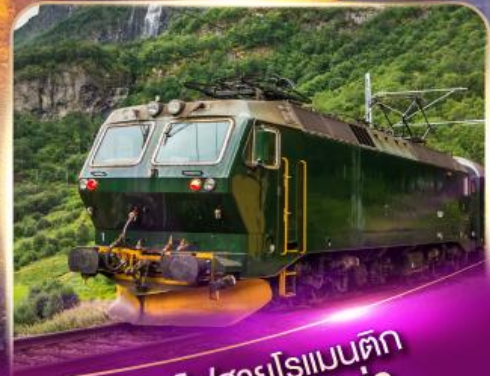
รถไฟสายโรแมนติก ฟลัมส์บาน่า