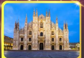
มหาวิหารแห่งเมืองมิลาน