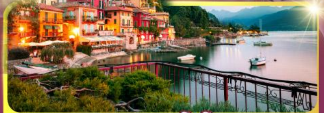
ทะเลสาบโลโบ