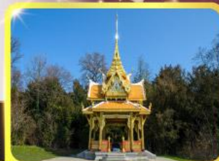
ศาลาไทยไชยาน์