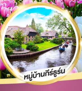
หมู่บ้านกัร์ธูร์น