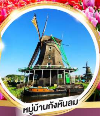
หมู่บ้านกังหันลม