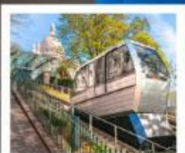
ขึ้นรถรางสู่มงมาร์ต