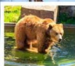
บ่อหมีเมืองเบิร์น