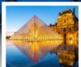
ถ่ายรูปพีไฟร์กันที่ลูฟร์