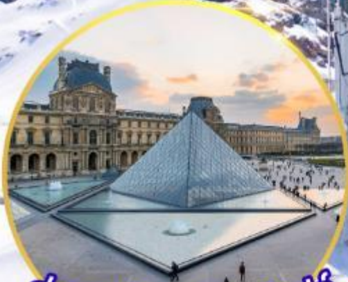
ถ่ายรูปพิพิธภัณฑ์ลูฟร์