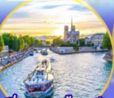
ล่องเรือแม่น้ำเซน