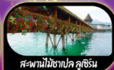
สะพานไม้ชาเปล ลูซิิร์น