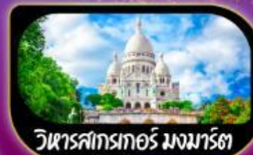
วิหารสกรเกอร์ มงมาร์ต