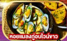
หอยแมลงภู่อบไวน์ขาว