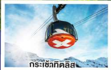
กระเช้ากิตติส