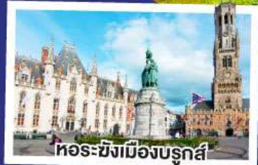
หอระฆังเมืองบรูจส์