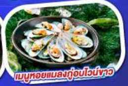
เมนูหอยแมลงภู่อบไวน์ขาว