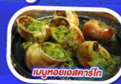
เมนูหอยแอสคาร์โท

ทานอาหาร ณ ภัตตาคารบนหอไอเฟล พร้อมชมวิวแสนโรแมนติก เมนูหอยแมลงภู่อบไวน์ขาว