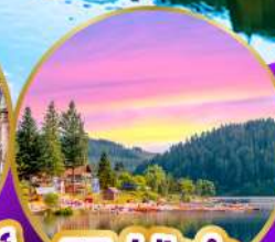
ทิทเซ่ ปาด้า