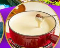
ฟองคูชีส