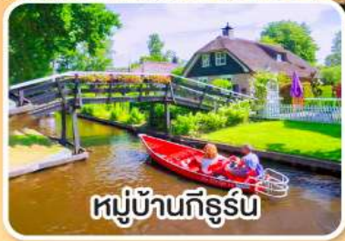
หมู่บ้านทึร์น