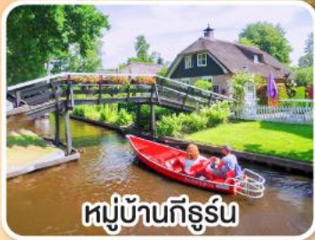
หมู่บ้านกิธูร์น